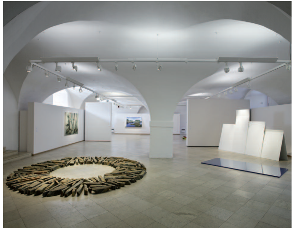
Richard Long, Gloria Friedmann [coll. Frac Bourgogne]

Naturalia était guidée par l'intérêt sans cesse renouvelé des artistes pour la nature, pour ses créatures et ses créations, pour les éléments, les êtres vivants et les paysages qui la composent. Elle analysait avec une grande sensibilité l'appropriation et la réinvention de la nature et de ses phénomènes par les artistes, mêlant figures historiques et création la plus actuelle, œuvres des collections et productions spécifiques. Naturalia was centred on artists' ever-renewed interest in nature, in nature's creatures and creations, and the elements, living beings and landscapes that it embraces. Cutting-edge art, works by historical figures, works from the collections and specific productions came together in this exhibition which analysed, with great sensitivity, the appropriation and reinvention of nature and natural phenomena by artists.